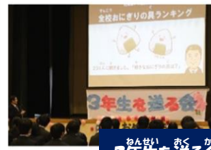
おんかい かく かい 3年生を送る会