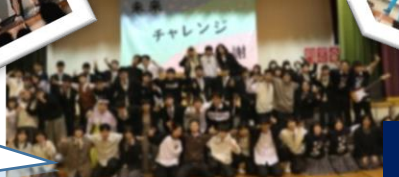
がっこうさい 学校祭