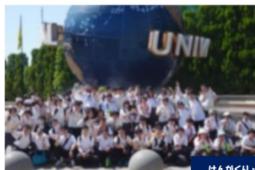
けんがくりょこう がくねん 見学旅行(3学年)

USJでアトラクションに乗ったり、 お土産を買ったりして、 とても充実した3日間でした。