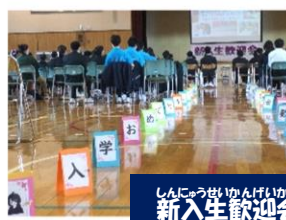
しんにゅうがくせいげんかい 新入生歓迎会

サークル あいcircleでは、地域の温かさを感じ ました。接客が楽しかったです。