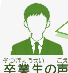
そつぎょうせい こえ 卒業生の声

USJでアトラクションに乗ったり、 お土産を買ったりして、 とても充実した3日間でした。